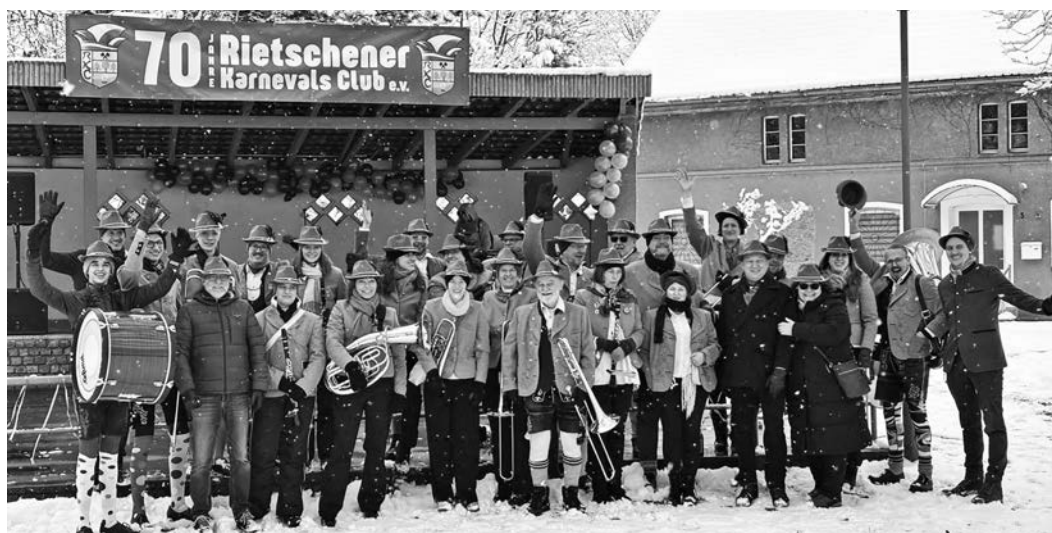
Die Feldkirchner Delegation beim Rietschener Karneval