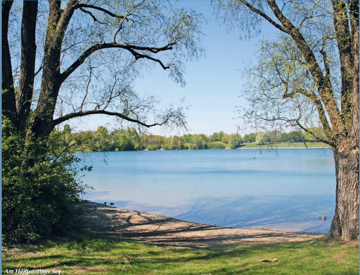
Am Helmstettner See