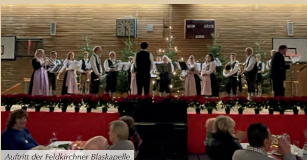
Auftritt der Feldkirchner Blaskapelle