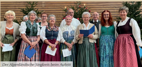
Der Alpenländische Singkreis beim Auftritt