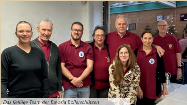
Das fleißige Team der Bavaria Böllerschützen