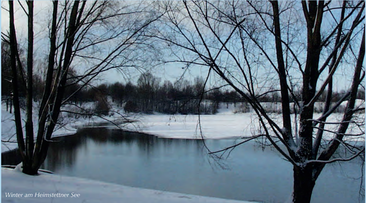
Winter am Heimstettner See