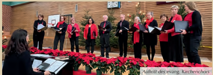
Auftritt des evang. Kirchenchors