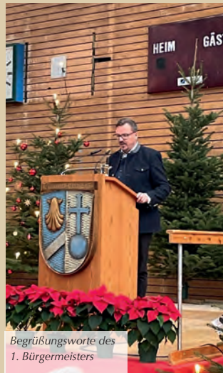
Begrüßungsworte des 1. Bürgermeisters