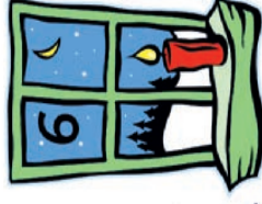
Breitschaft/ Raßhofer Brunnenstraße