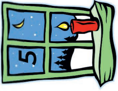
Fam. Ragna / Sturm Wittelsbacher Str. 8