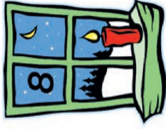
Wohngem. Nemecek Oberndorfer Str. 23a