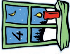
Elterngemeinschaft Königsberger Weg