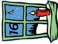
Fam. Wienold Brauereiweg 2