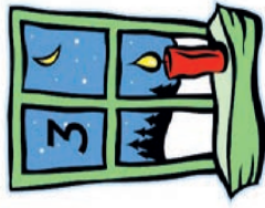
TSV Feldkirchen Olympiastr. 3