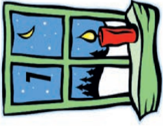
Madlverein FK Bahnhofstr. 5