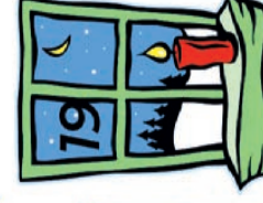
Gaa Geuer Glossner Friedensstr. 9 a/b