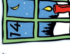
Fam. Grimm Ottostr. 4a