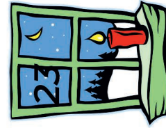
Gartenbauverein Fasanweg Lehrgarten