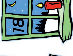
Ev. Kirchengemeinde Bahnhofstr. 3