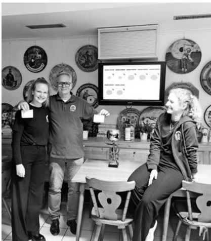
Ziehung der Gewinner

Auch diesem Jahr konnte die Altschützengesellschaft zum „Tag der offenen Tür“ am 11.11.2023 wieder zahlreiche Gäste begrüßen. Er war eine gute Gelegenheit, mehr über den Schießsport sowie unseren Verein zu erfahren und vielleicht dabei eine neue Leidenschaft zu entdecken. Der Schießsport ist eine der wenigen Sportarten, die für fast alle Altersklassen geeignet ist. Die Jüngsten konnten sich daher einmal am ungefährlichen Lichtgewehr ausprobieren, alle anderen ihre Koordination und Konzentration mit einer Runde an der Pistole oder dem Luftgewehr (auch mit Auflagemöglichkeit) testen. Zur Freude einiger Teilnehmer gab es dann auch gleich einige „Volltreffer“. Für das leibliche Wohl in Form von leckerem hausgemachtem Kuchen sorgte wieder der Damenstammtisch des Vereins. Im Anschluss zog eine unserer diesjährigen Schützenköniginnen als „Glücksfee“ die Gewinner der kostenlosen Mitgliedschaft für ein Jahr. Alle, die keine Gelegenheit hatten, an diesem Nachmittag dabei zu sein, sind herzlich zum Vereinsabend eingeladen.