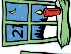
Kath. Frauen Kreuzstr. 6