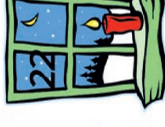
Ministranten und PGR St. Jakobus Kath. Pfarrgarten