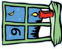
Burschenverein Olympiastr. 1