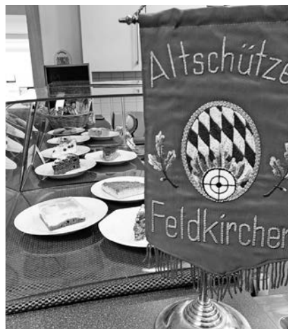
Leckere hausgemachte Kuchen