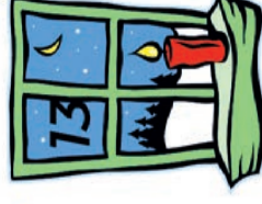
Schild & Simonini Bodmerstr. 5