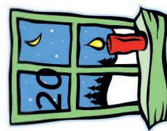
Fam. Schwickal Egerländer Str. 4a