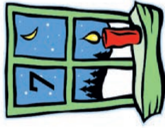
Guhlike und Zagorac Von-Tucher-Str. 1