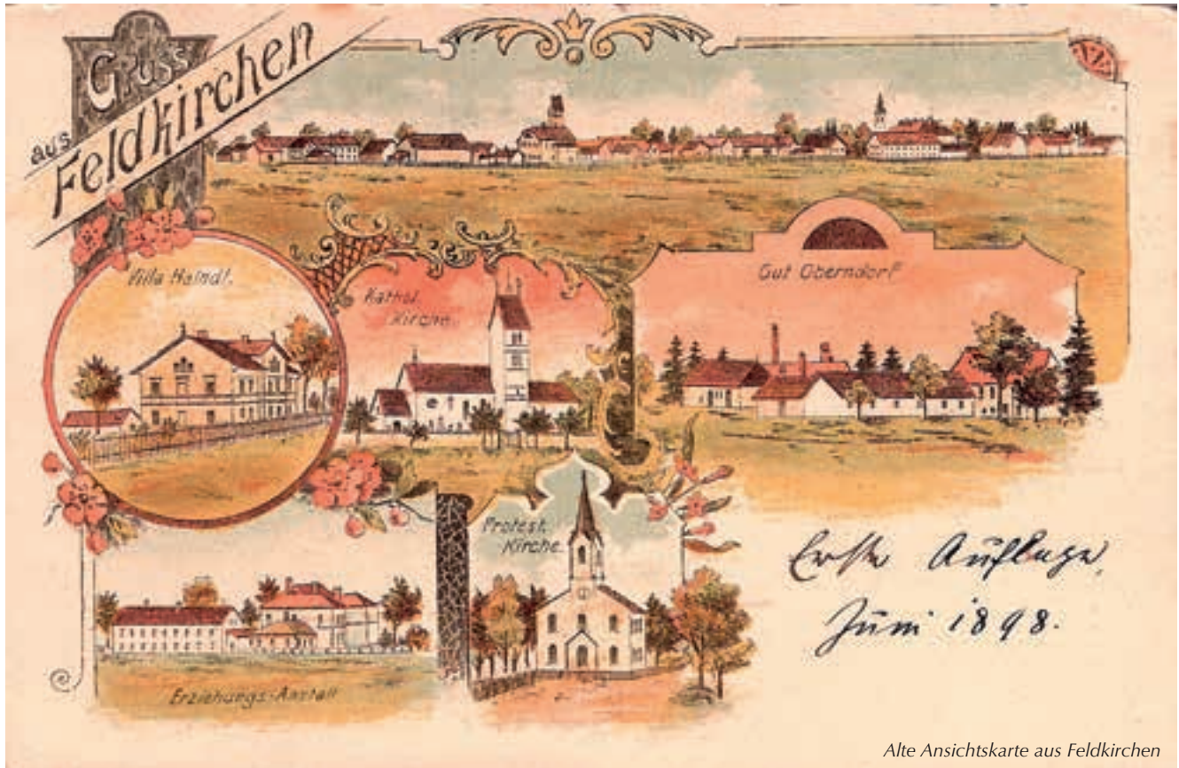
Alte Ansichtskarte aus Feldkirchen